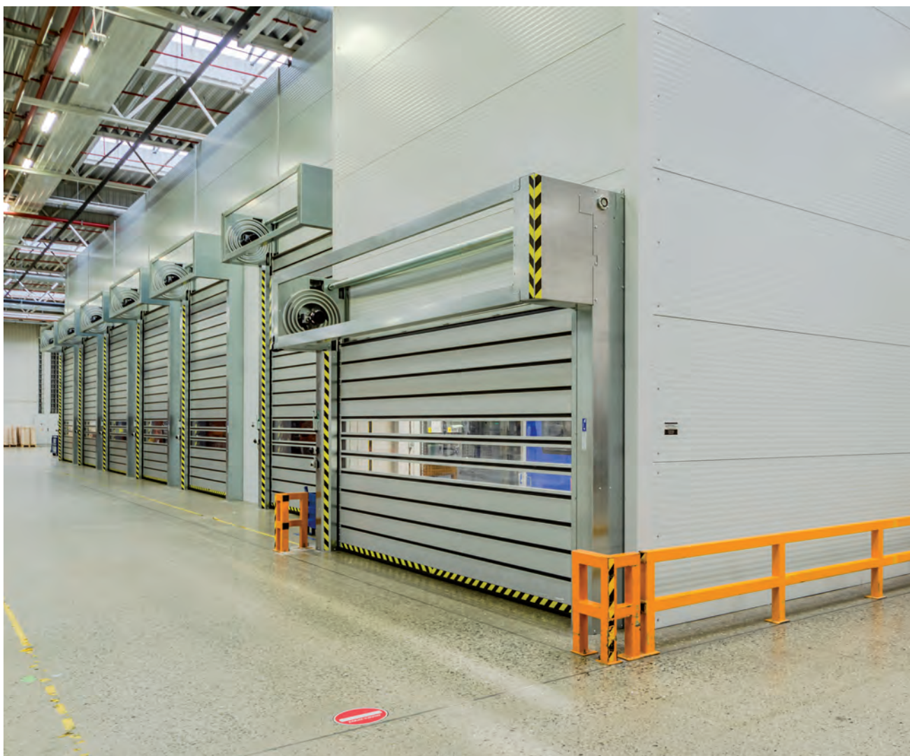
Spirálová vrata typu EFA-SST, Miele technika, Uničov