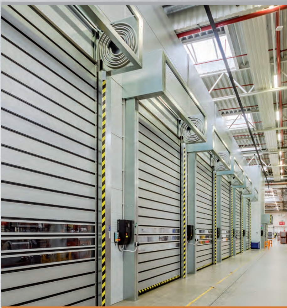
Foto na obálce: Vysokozdvížené vozíky, Červená Voda, zadní strana: Miele, Uničov

EFAFLEX® je registrovanou a právně chráněnou značkou.