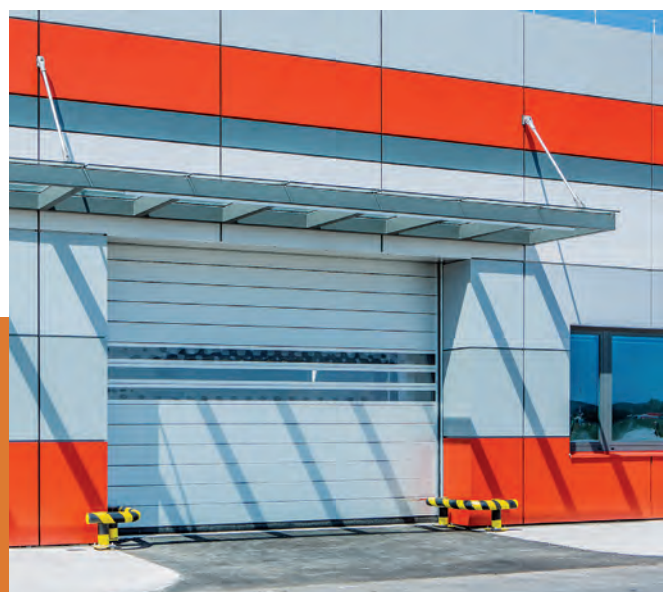
Spirálová vrata, Letiště České Budějovice