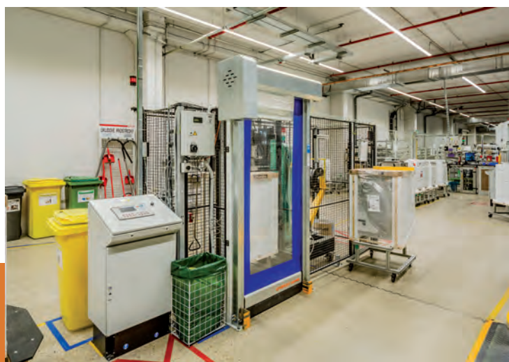
Vrata pro robotická pracoviště, Miele technika, Uničov