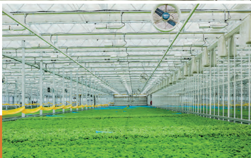
Rolovací vrata ve firmě Bylinky, Suchohrdly u Miroslavi