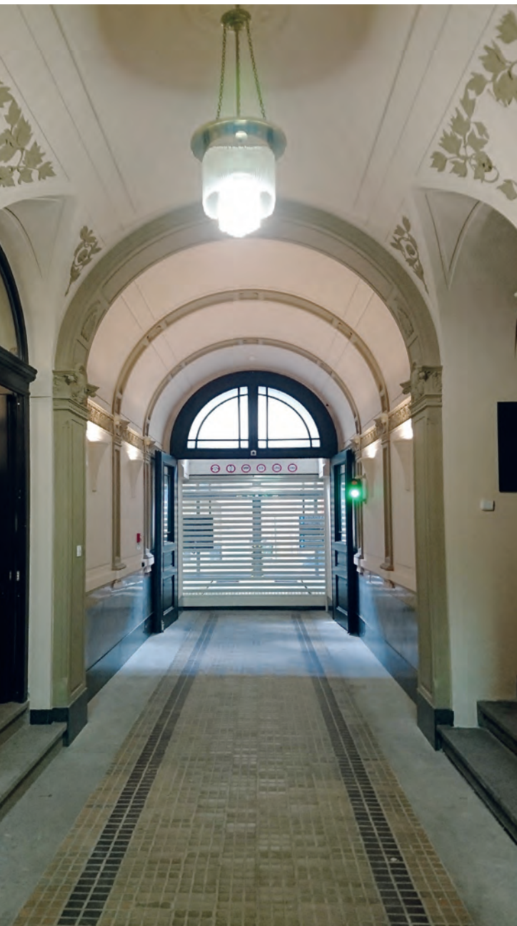
Moderní vrata v secesním domě