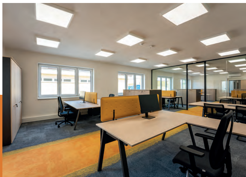
Rekonstrukce administrativních budov