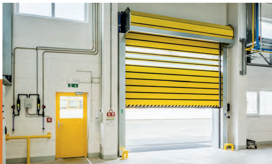
Spirálová vrata ve firmě Hutchinson, Rokycany