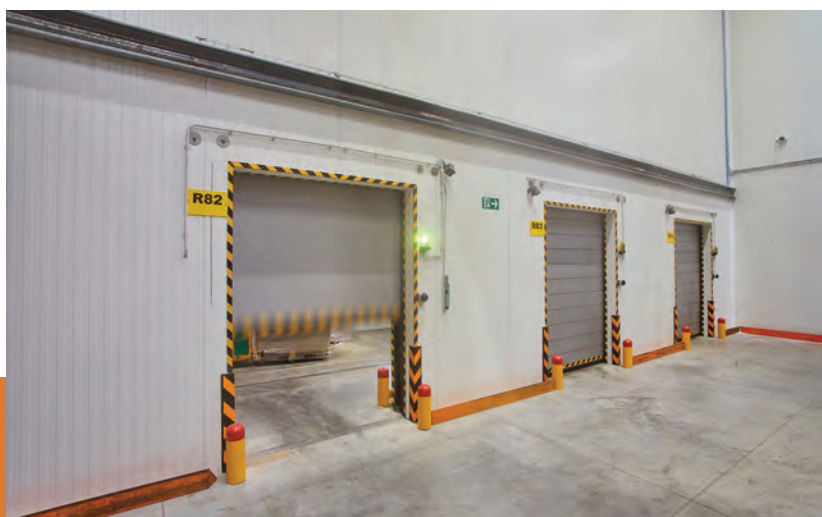
Mrazírenská vrata ve firmě HOPI, Lažany