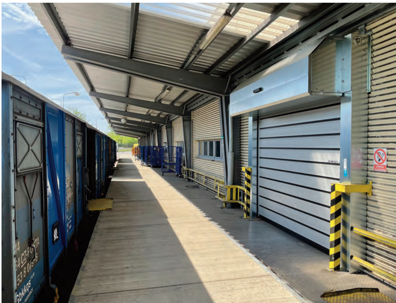
Rychloběžná vrata ve firmě Česká pošta, s.p.