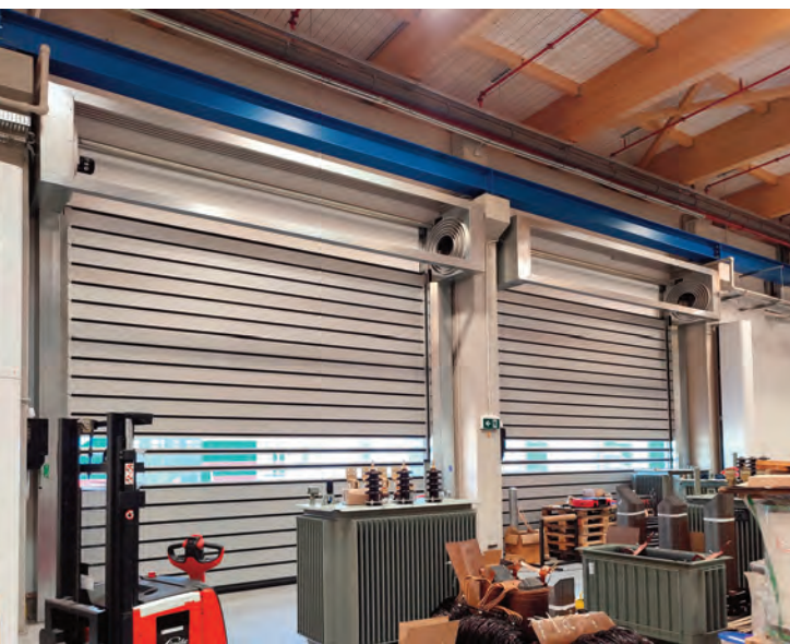
Spirálová vrata ve firmě Elpro-Energo Transformers