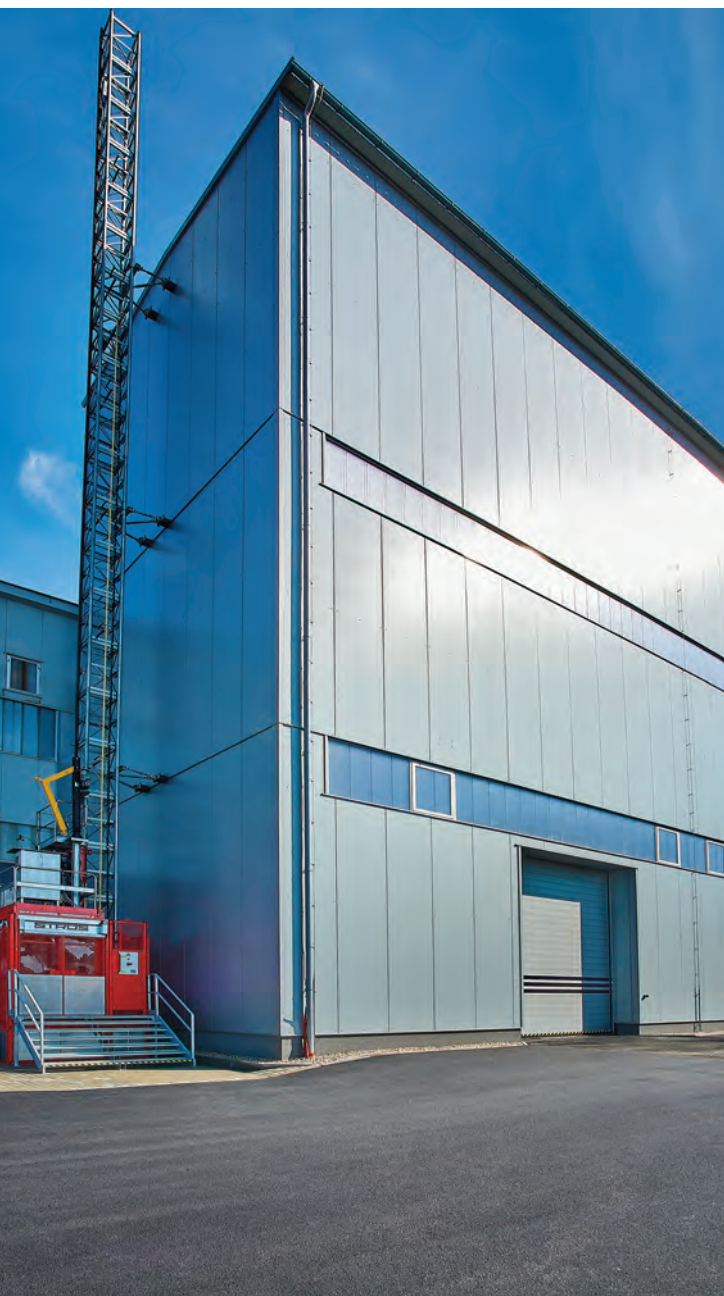
Rychloběžná vrata ve firmě STROS-Sedlčanské strojírna