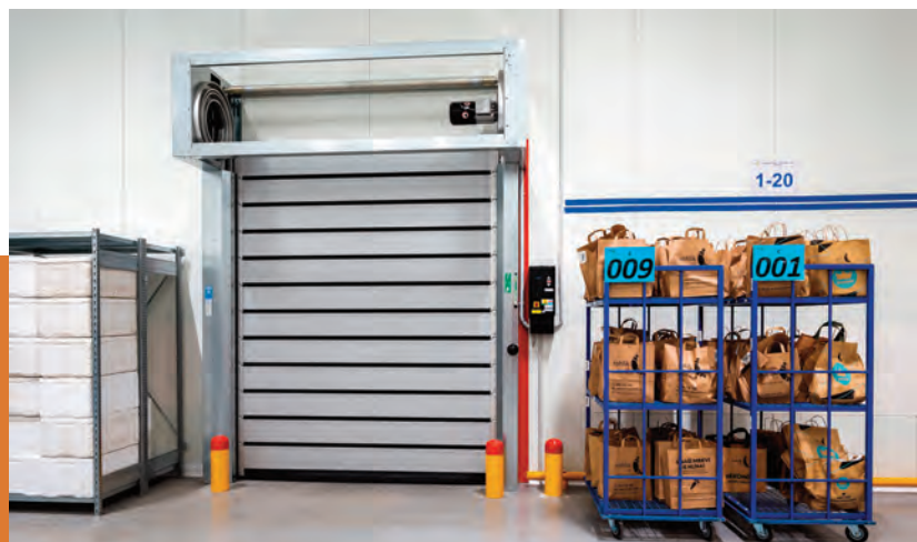
Spirálová vrata ve firmě Velká Pecka